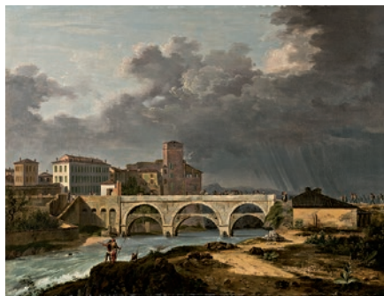
MARCO GOZZI Il ponte sulla Muzza a Cassano (Passaggio delle truppe alleate sul ponte di Cassano) Olio su tela, 60 x 79 cm