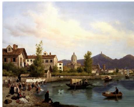
GIUSEPPE CANELLA Veduta di Como Olio su tela, 53 x 68 cm

Verso la fine del secolo andranno invece affermandosi nuove poetiche basate sulla scomposizione della forma e del colore, assecondando le quali artisti come Gerolamo Induno o Silvio Poma produrranno ancora originali interpretazioni del paesaggio dell'Adda. (MM)