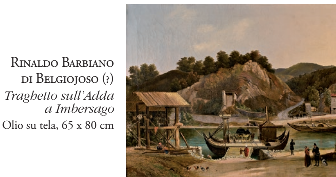
RINALDO BARBIANO DI BELGIOJOSO (?) Traghetto sull'Adda a Imbersago Olio su tela, 65 x 80 cm